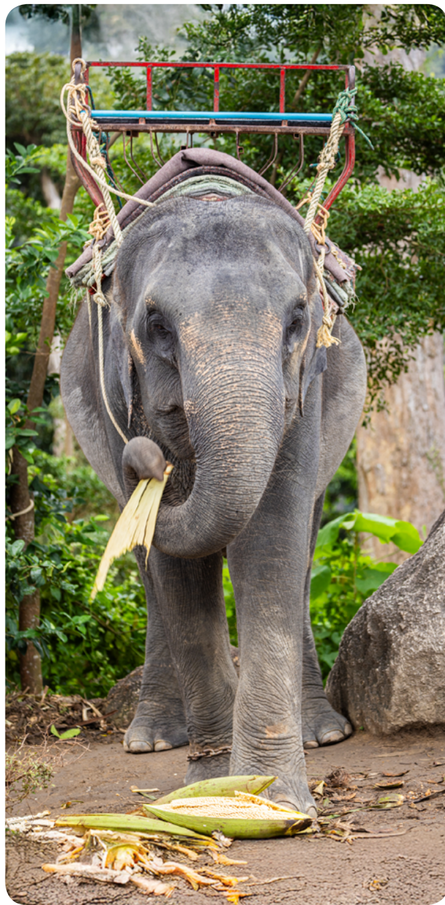
上图：在泰国，供游客骑乘的大象。

泰国对于圈养大象的法律框架滞后而且零散。法律对野生大象提供了非常严格的保护，然而，圈养大象仍然被归类为“家畜”，而这一划分的依据是 1939 年颁布的法律。这种双重管理体系带来了实际操作中的法律漏洞，默许不受法规监督的圈养繁育行为，使得圈养大象几乎无法获得任何实质上的动物福利保障。2014 年颁布的《防止虐待动物及动物福利法》虽然在原则上提供了广泛保护，但是缺乏可执行、针对具体物种的标准。法律实施困难，认证体系基于自愿且效率低下。尽管国内国际层面均获得广泛支持，系统性的变化却始终停滞不前。