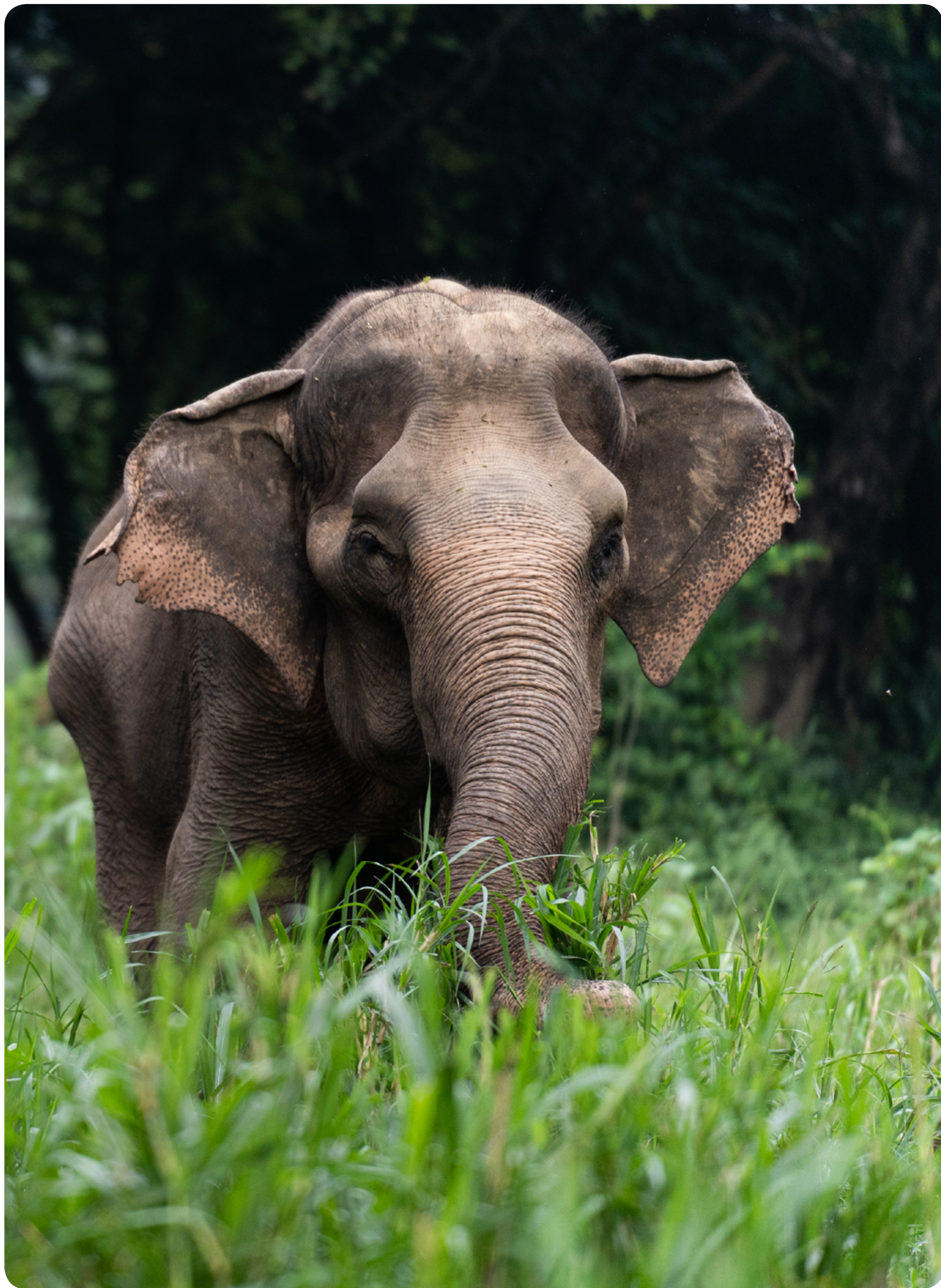
上图：在泰国，生活在以“观察为核心”的体验场所中的大象。